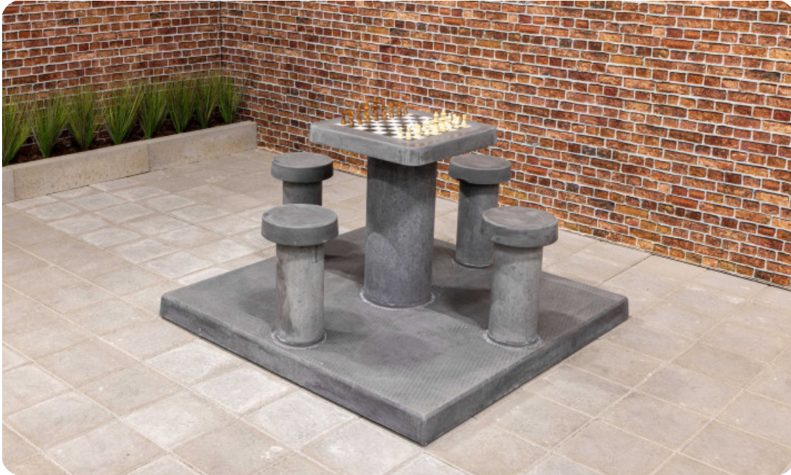
Table d'échecs en béton anthracite, 4 personnes