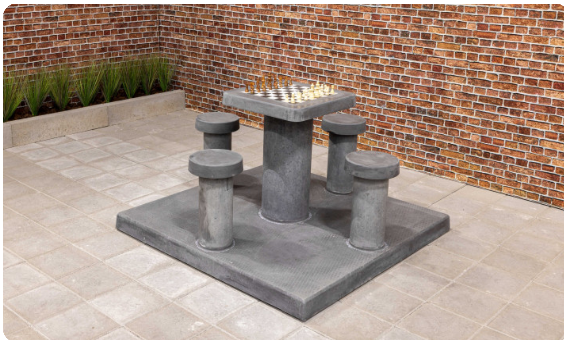
Table d'échecs en béton anthracite, 4 personnes